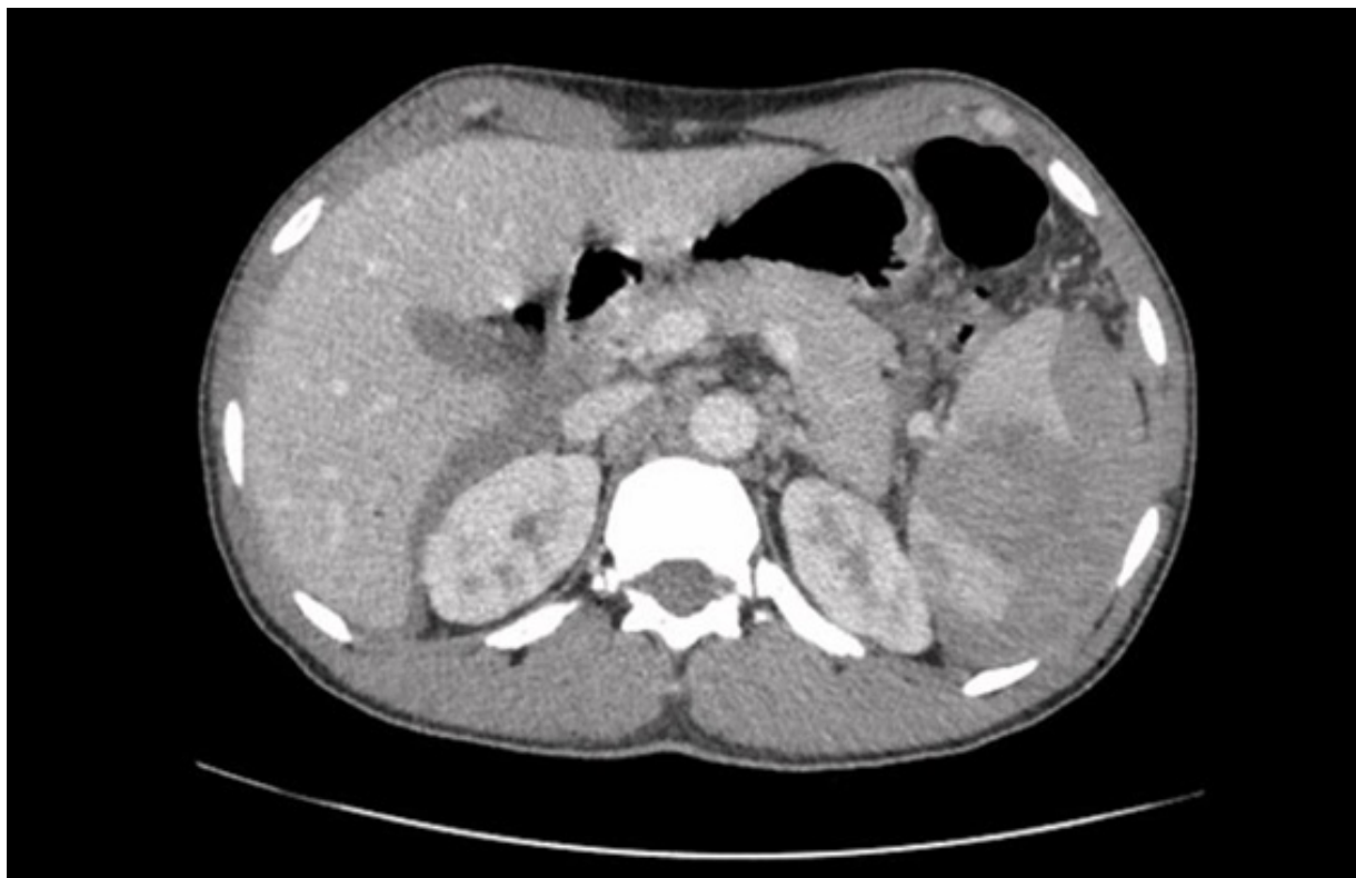
Figura 1. Tomografia Computorizada (TC) abdominal e pélvica à admissão no Serviço de Urgência.

Por subida sustentada dos parâmetros de citocoléstase hepática (tabela III), realizou nova TC abdominopélvica que revelou “hepatomegalia (cerca de 22 cm de eixo longitudinal), mínimas imagens nodulares hipocaptantes, localizadas no segmento IVa e várias no lobo hepático direito, de difícil caracterização pelas suas reduzidas dimensões, hipertrofias ganglionares diafragmáticas direitas e adenopatias em topografia do hilo hepático, celíacas, inter-porto-cava, lombo-aórticas e inter-aortocavas, as maiores com cerca de 1,9 cm e 2 cm de maiores diâmetros”. Referiu, ainda, presença de “ascite nos recessos peritoneais superiores, goteiras parieto-cólicas e recessos peritoneais inferiores”.